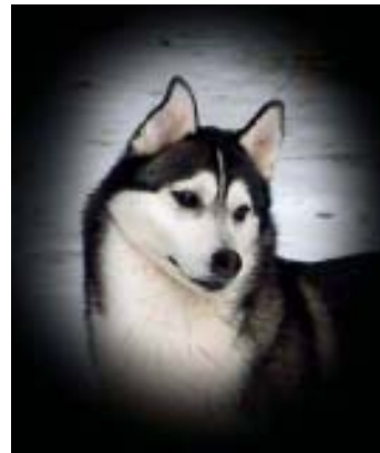
ขนยาวพอดี

สี ขนสามารถมีสีตั้งแต่ดำ จนถึงสีขาว บริเวณหัวอาจจะมี marking ได้