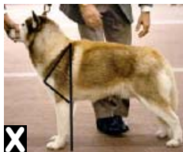
กระดูกหัวไหล่ยาวกว่ากระดูกขาหน้าทอนบน