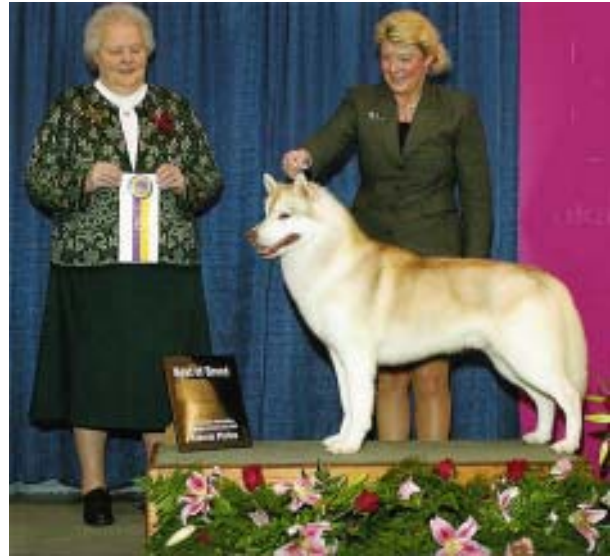
Siberian ที่มีมุมขาหน้า-หลังดี

ขอเท้า (pasterns) ตรง นิ้วเท้ากลมหนา ไม่ใช่ลักษณะที่ดี ของ Siberian