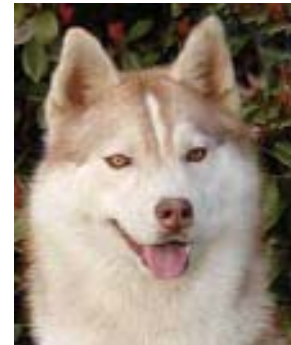
ลักษณะส่วนหัว ของ Siberian ที่ถูกต้อง