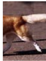
ลักษณะหาง ที่ถูกต้อง