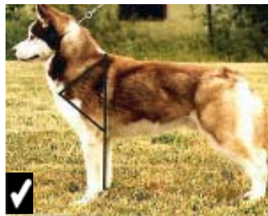
กระดูกหัวไหล่และกระดูกขาหน้าทอนบนทำมุมกันพอประมาณ กระดูกหัวไหล่ยาวเท่ากับกระดูกขาหน้าทอนบน

เท้ากลมรีแต่ไม่ยาว บริเวณระหว่างนิ้วเท้าและอุ้งเท้ามีขนหนา นิ้วเท้าชิดกัน เท้าชี้ตรงไป ด้านหน้าเท้าไม่บิดเข้าหรือบิดออก