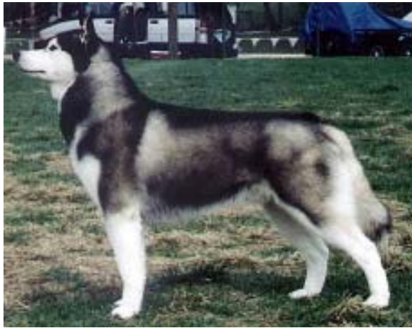
สัดส่วนโครงสร้างของ Siberian